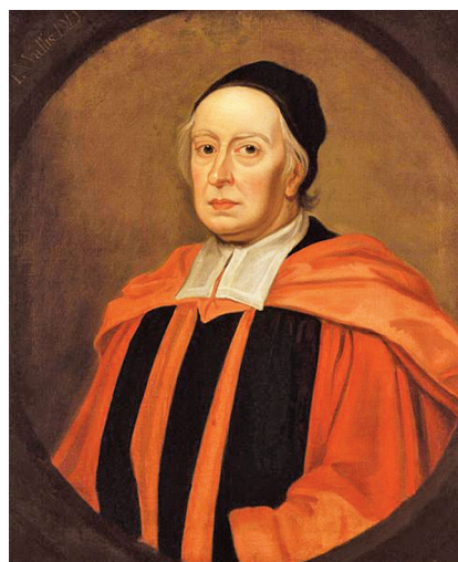
Slika 1. John Wallis

Simbol \infty kao oznaku za beskonačnost, točnije: za beskonačan broj, uveo je engleski matematičar John Wallis (1616. – 1703.). Wallis (slika 1) je bio najznačajniji engleski matematičar prije Newtona, a osim za povijest matematike značajan je i za povijest engleske gramatike, glazbene teorije te pedagogije: sudjelovao je u osmišljavanju jedne metode podučavanja gluhonijemih osoba. Tijekom engleskog građanskog rata bavio se i kriptografijom –