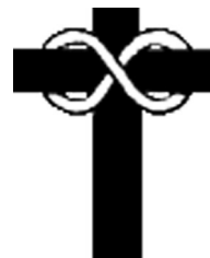
Slika 4. Križ sv. Bonifacija

u skupu prirodnih brojeva, koji svakako jest beskonačan sam po sebi, ne koristimo se ovim simbolom već Cantorovim \aleph_0 , a postoje i druge oznake aktualno beskonačnih brojeva koje se koriste u sklopu teorije skupova.